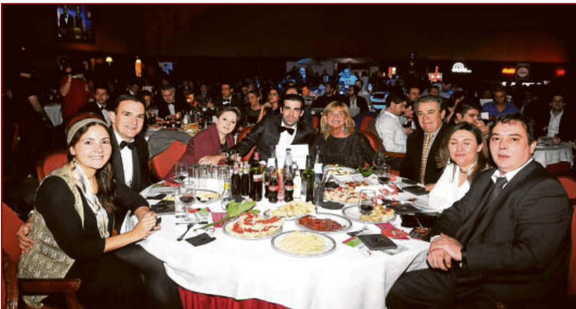
Representantes del Castillo del Buen Amor.