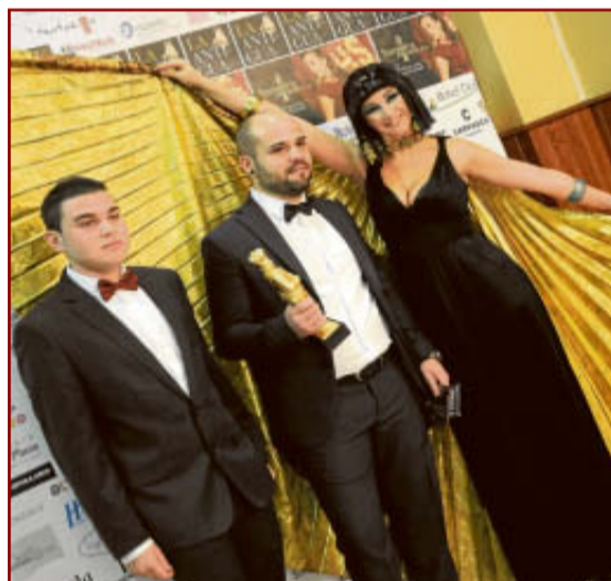
Antes de entrar en el salón, los invitados posaron para que las cámaras captaran sus instantáneas en el photocall.