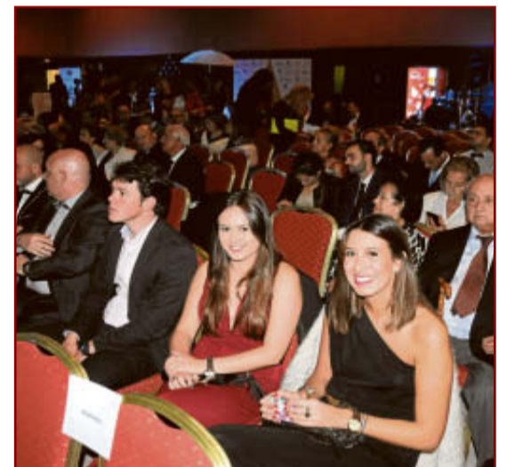
La zona de butacas también se llenó de público, en total la fiesta contó con casi un millar de asistentes.